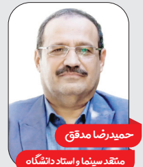
حمیدرضا مدادی محقق سینما و استاد دانشگاه