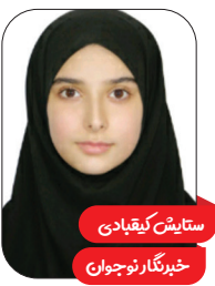
ستایش کیهانی خبرنگار نوجوان

ببعی قهرمان» به کارگردانی مشترک حسین صفارزادگان و میثم حسینی و نویسندگی مقصد اخوان در سی و ششمین جشنواره بین‌المللی فیلم‌های کودکان و نوجوانان به نمایش درآمد. این انیمیشن، به داشتن اراده و هدف مشخص در زندگی و این موضوع که هر شکست می‌تواند پلی به سوی موفقیت باشد، اشاره دارد و در بدنه فیلم ملموس‌ترین نکته، تلاش برای رسیدن به هدف و نامید شدن است.