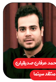
محمد عرفان صدیقیان منتقد سینما